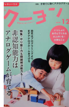
図1 月刊クーヨン表紙

たとえば表中の2番「月刊クーヨン」2020年12月号の表紙上の特集タイトルは、『子育てに効くアナログゲーム：やり抜く力も問題解決能力も……非認知能力はアナログゲームが育てる』(図1)とつけてある。