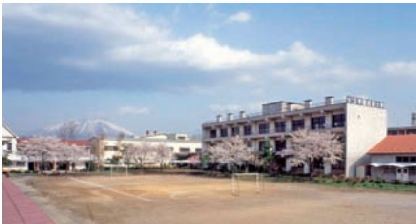
生活学園短期大学 食物栄養科（昭和39年～平成2年）

さらに、平成12年度から盛岡福祉専門学校と提携し、訪問介護員（ホームヘルパー）2級の資格を取得できるコースを開設していた。