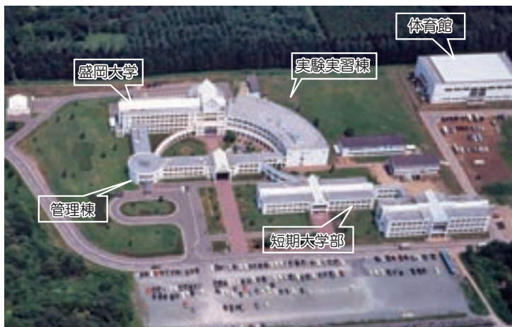
滝沢村砂込キャンパス（平成 15 年頃撮影）