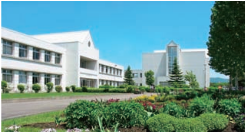
盛岡大学短期大学部（平成2年～）

最後に、この「食物栄養科のあゆみ」を作成するに当たって、終始ご援助下さいました事務局総務部の皆さん、短期大学部学生部の皆さんに心から感謝いたします。